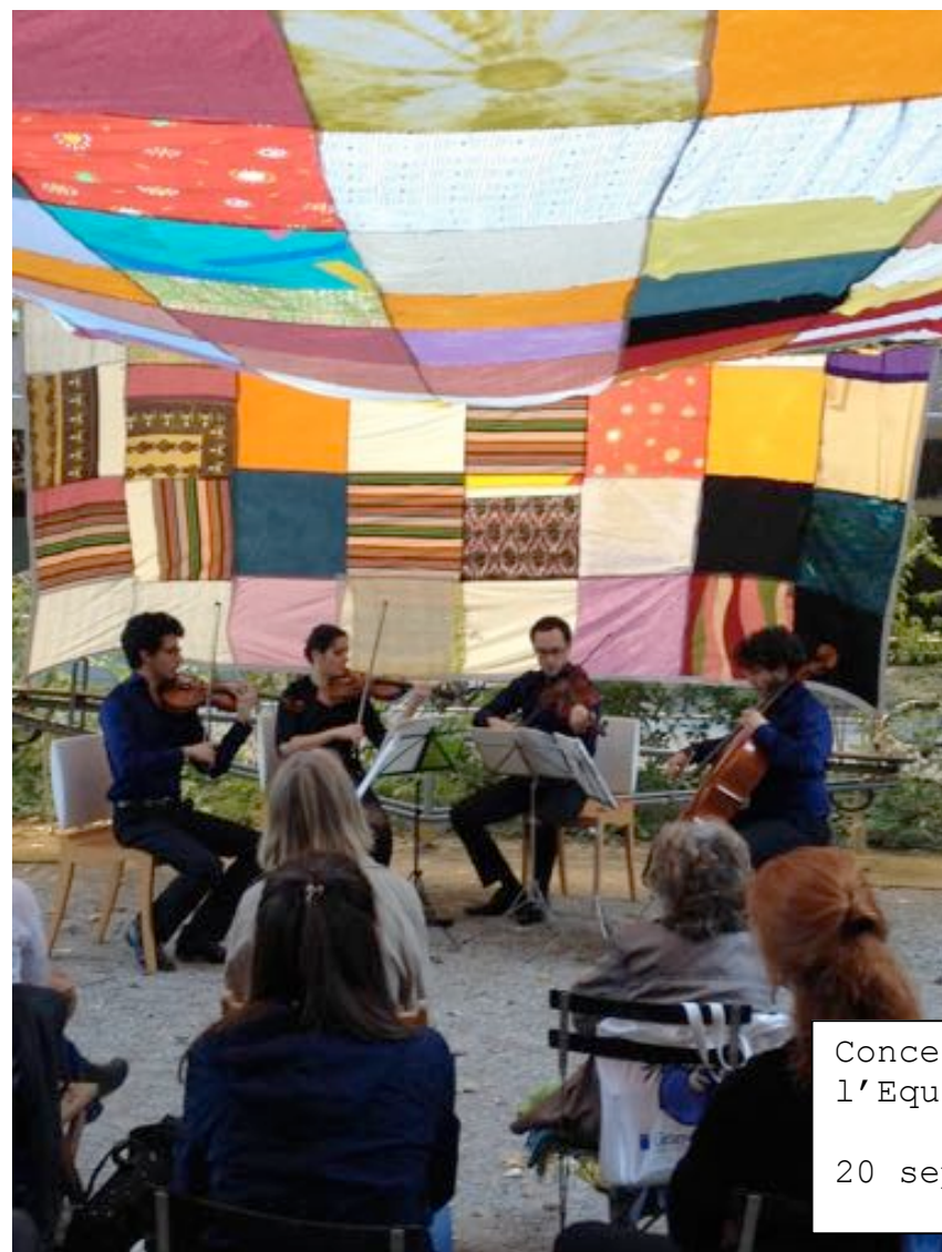
Concert de l'Equinoxe 20 septembre