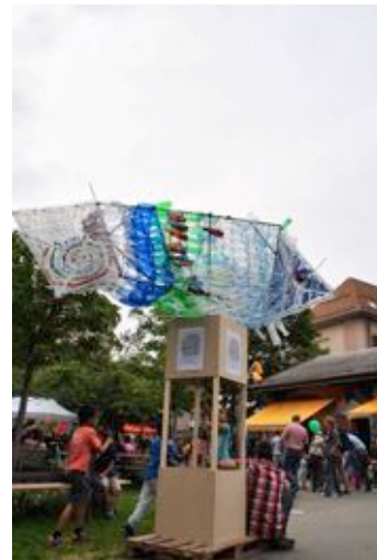
14 mai 2015 fête du Printemps au parc Gourgas installation des totems-poissons et atelier peinture sur les bacs du potager de la rue du Village-Suisse