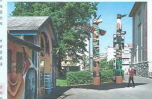
Les mâts-totems sont installés à côté de la « Pépinière », annexe de la Maison de quartier de la Jonction, et à proximité de l'école.

Quant aux mâts-totems originaux, ils sont précieusement conservés dans les collections du MEG. S'ils ont perdu leurs couleurs d'origine, ils sont en bon état général de conservation malgré de nombreuses années d'exposition aux intempéries. Trop hauts pour être présentés dans les salles d'exposition, ils devraient pouvoir être installés un jour dans un des espaces communs du nouveau bâtiment.