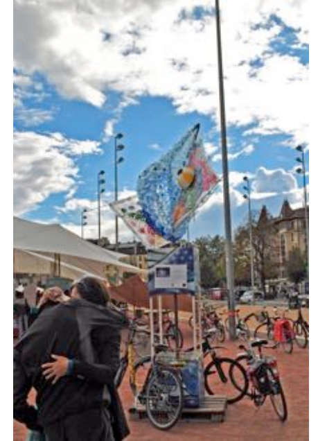
Alternatiba, 19-20 septembre, Plainpalais - installation Vortex - Puna & 60x60 -