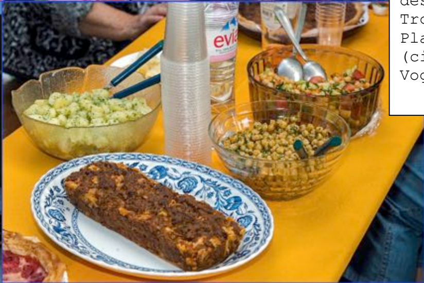
23 mai Fête des Voisins au square des Trois Platanes (cité Carl- Vogt Honegger)